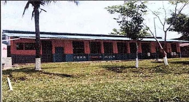
Foto1: Cambio de te cubierta y estructura de techo (Laminas picadas, quebradas y con agujeros)